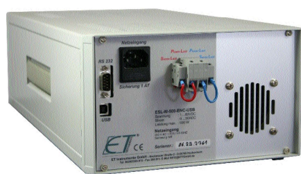
Rückansicht ESL-Solar 500 im 235x135x435mm Gehäuse mit standardmäßigem Tragegriff

Für Systemanwendungen ist eine Ausführung als Dualgerät verfügbar, d. h. zwei Lasten in einem Gehäuse (19", 2HE, 380mm), ohne Bedienung und Anzeige, Typ ESL-Solar 500D-ENC. Optional ist die ESL-Solar 500 mit einem Bestrahlungsstärke- und Temperaturmesssensor lieferbar. Die Bestrahlungsstärke hat einen Messbereich von 0...1200W/m 2 und ein Temperaturmessbereich von -20°C bis +80 °C. Die Optionsbezeichnung lautet "S". Über die Software wird laut Norm DIN EN 60891 die Peakleistung der Module auf 1000W/m 2 berechnet.