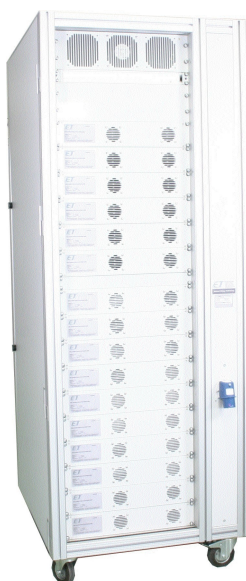
Die Abbildung zeigt ein System zur parallelen Prüfung von 32 Solarmodulen. Bestückt ist das System mit 16 Stück ESL-Solar 500D-ENC.