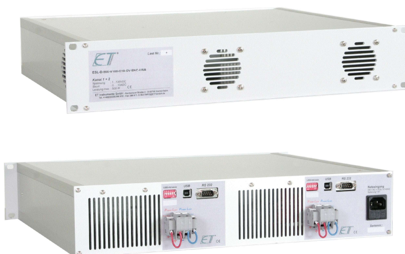
Front- und Rückansicht ESL-Solar 500D-ENC im 19", 2HE, 380mm Gehäuse